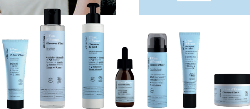
Un aperçu de la gamme L'Eau d'Évaux